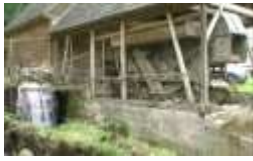
Apa si viata